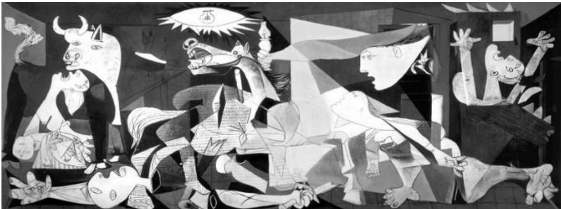
PICASSO, P. Guernica . Óleo sobre tela. 349 × 777 cm. Museu Reina Sofia, Espanha, 1937.

O pintor espanhol Pablo Picasso (1881-1973), um dos mais valorizados no mundo artístico, tanto em termos financeiros quanto históricos, criou a obra Guernica em protesto ao ataque aéreo à pequena cidade basca de mesmo nome. A obra, feita para integrar o Salão Internacional de Artes Plásticas de Paris, percorreu toda a Europa, chegando aos EUA e instalando-se no MoMA, de onde sairia apenas em 1981. Essa obra cubista apresenta elementos plásticos identificados pelo: