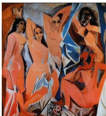
As damas d'Avignon de Pablo Picasso

O cubismo surgiu em 1907 através das pinturas de Pablo Picasso, em especial a tela As damas d'Avignon. Este movimento teve como base a geometria das formas e o fator abstrato.