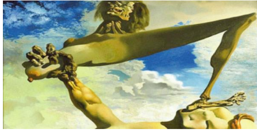
Surrealismo de Salvador Dalí

O surrealismo tem origem na Paris de 1924 e tem como referência o subconsciente, a fantasia e os devaneios oníricos. Alguns dos artistas mais famosos deste movimento são: Salvador Dalí, Max Ernst, Giorgio de Chirico, René Magritte e Joan Miró.