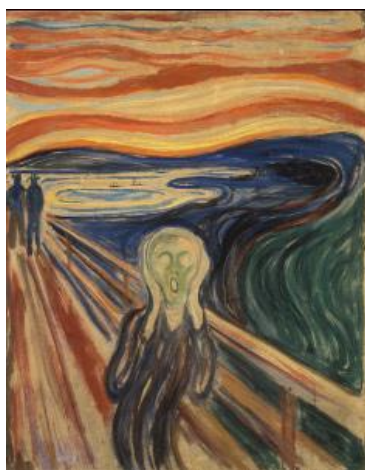
O Grito de Edvard Munch

Começou na Alemanha em 1905 e é baseado nas expressões dos sentimentos e emoções. Costumava focar na parte ruim da mente humana, por vezes irracional, trágica e bem pessimista.