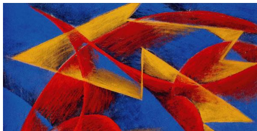
Giacomo Balla e o futurismo

O movimento surgiu em 1909 com o poeta italiano Filippo Marinetti. O futurismo tem a intenção de destacar as tecnologias da época (como as maquinarias) e abraçar o futuro. Um dos principais artistas futuristas foi Giacomo Balla.